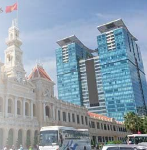
手前：ホーチミン人民委員会庁舎・奥：ビンコムセンター