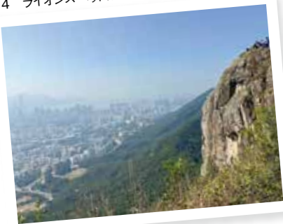
※4 ライオンズヘッド近くからの絶景

香港は高層ビルが立ち並ぶ近代的な都市ですが、香港の約40%はカントリーパーク(開発不可エリア)で多くの自然も残っています。その中でも私のおすすめは、香港の象徴の一つで、絶景が楽しめるライオンロック(獅子山・Lion Rock)のハイキングコースです(※4)。香港島や九龍の美しい街並みが一望できる数多くのビューポイントがあり、香港人や観光客にも人気の山です。