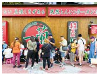
※3 一蘭 2023年11月1日 新店舗オープンの様子

際、味や食事スタイルを香港人の嗜好にあわせる飲食店もありますが、弊社の場合は、日本のスタイルをそのまま持ち込んだことが、結果的に「差別化」につながったと思います。また、日本で弊社のラーメンを食べた香港人の多くが、本場の味や食事スタイルを求めていたことも成功の要因の一つだと思います。