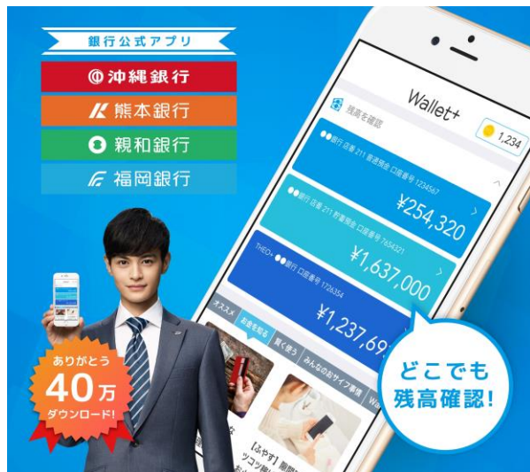
※写真はイメージであり、実際の賞品内容とは異なります。