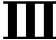
Minna no Ginko