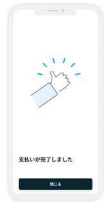
支払い完了(アプリ登録口座から引落し)