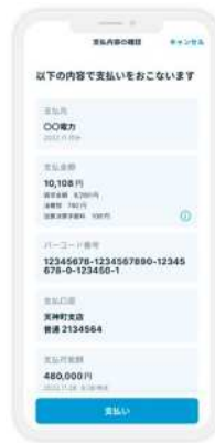
支払い内容の確認