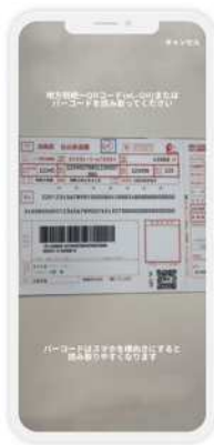
QRコードまたはバーコードを読み取り