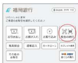
「税金の納付」を選択