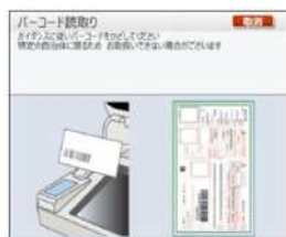
バーコードを読み取り