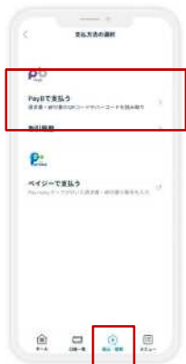
振込・振替メニューの PayBで支払いをタップ