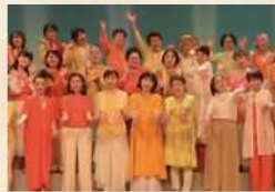
Sounds of DAZ サウンドズ オブ ダズ 2000年に太宰府市で発足したゴスペルサークル。