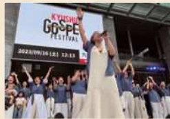
Mercy voice マージーヴォイス NPO法人poco a boccaの中で誕生したママがメインのゴスペルサークル。