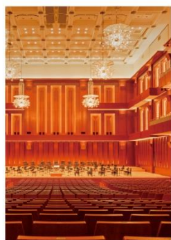
福岡シンフォニーホール(福岡市中央区)