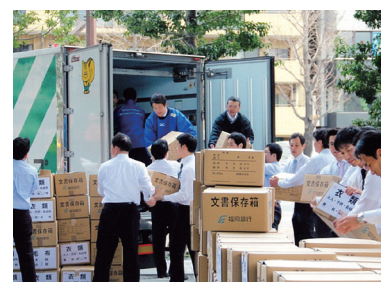
救援物資の積み込み