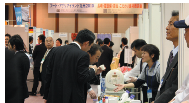
長崎・佐世保・雲仙こだわり食材商談会

また、行政とも積極的な連携を図っており、平成22年10月には北九州市などとの共催で「北九州フードチャレンジ商談会2010」を開催しました。11月には福岡銀行本店において、長崎・佐世保・雲仙3市主催の「長崎・佐世保・雲仙こだわり食材商談会」を共催、同会場にて「フード・アグリアイランド九州2010」を主催しました。なお同日は「長崎・佐世保・雲仙ゆめ市場キトラスフェア」も開催され、多くの方にご来場いただきました。