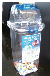
ペットボトルキャップの回収によるリサイクル