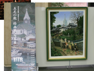
「五足の靴」絵画展・写真展