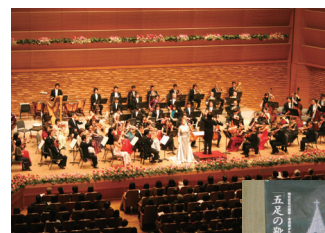
ニューイヤーコンサート