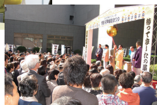
2010博多・天神落語まつり 招福寄席