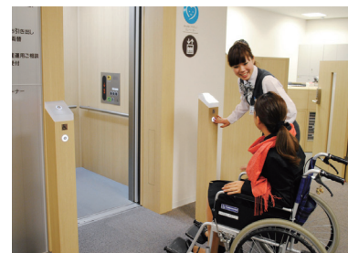
ゆったりとしたエレベーター