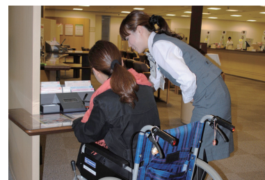
車椅子のまま利用できる記帳台