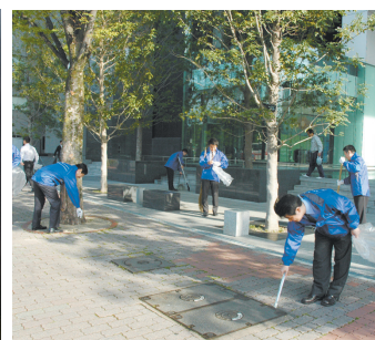
本社周辺の清掃活動の様子