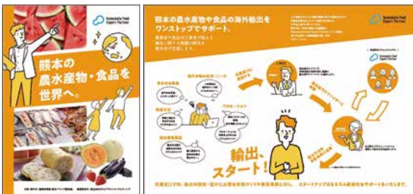
海外販路拡大支援事業のチラシ

ワークを活かし、海外販路拡大や海外進出を検討されているお客さまに対して各種サポートを実施しています。お近くの営業店にお気軽にお声掛けください。