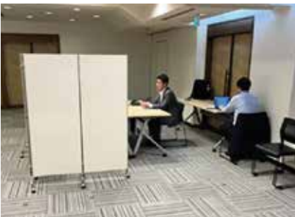
個別相談会の様子