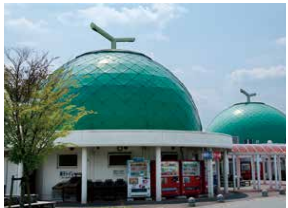
道の駅『七城メロンドーム』