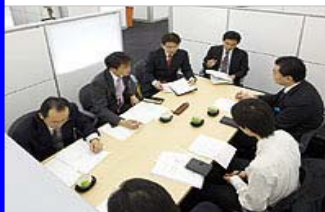
福岡銀行本店ビル5Fにビジネスマッチングフロアを常設