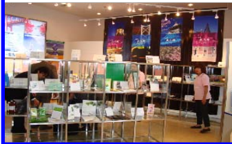
中国ビジネスを志向する取引先に、商品の展示・販売や技術PRを行う拠点を設置（北九州市との共同事業）