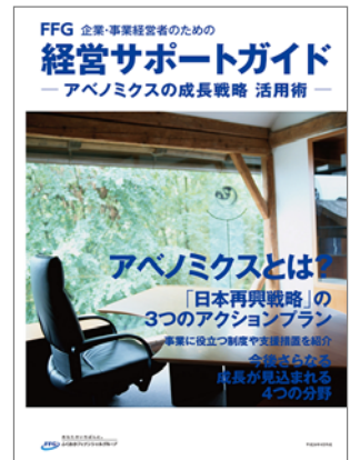
【経営サポートガイド】