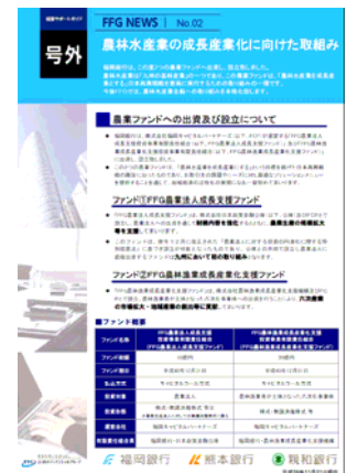
【経営サポートガイド号外】