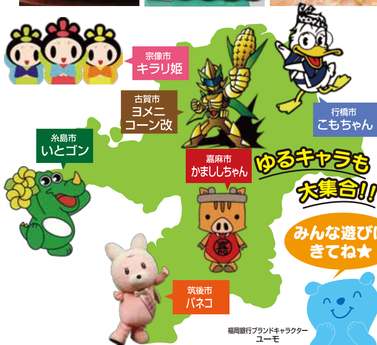
福岡銀行ブランドキャラクターユーモ