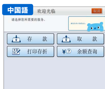
③ 各言語での取引選択画面（お預け入れ、お引き出し、通帳記入、残高照会）が表示されます