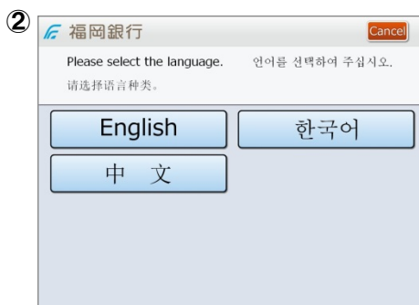
② 左記ボタンを押すことで言語選択画面が表示されます