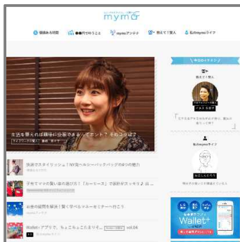
【mymoトップページ（Web版/スマホ版）】