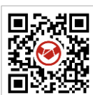
エンニチ 特集ページ