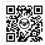
特集ページはコチラ