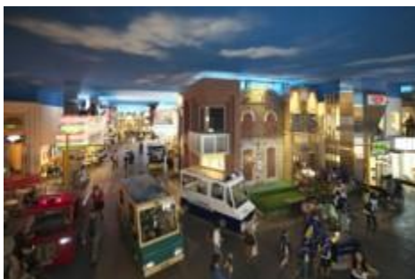
(キッザニアの街並み*)