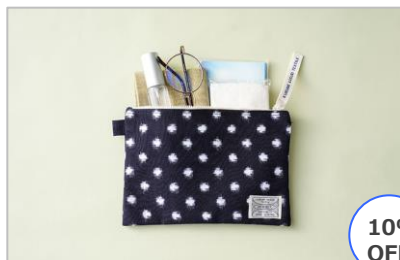
久留米絣ポーチM 紺/水玉