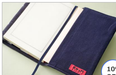
久留米絣ブックカバー 紺/水玉