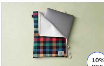
久留米絣マルチケース チェック