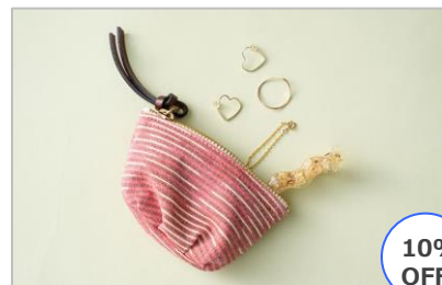
久留米絣ポーチ 手のひら 線ひし形