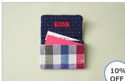
久留米絣名刺入れ 白×パープル/チェック