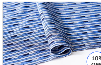
【切売】久留米絣（1m単位） グリーン×グレー/三色あられ