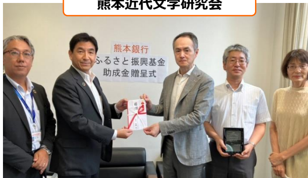
熊本近代文学研究会