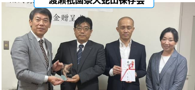
渡瀬祇園祭大蛇山保存会