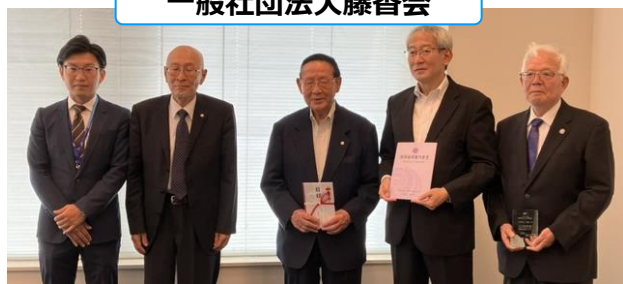
一般社団法人藤香会